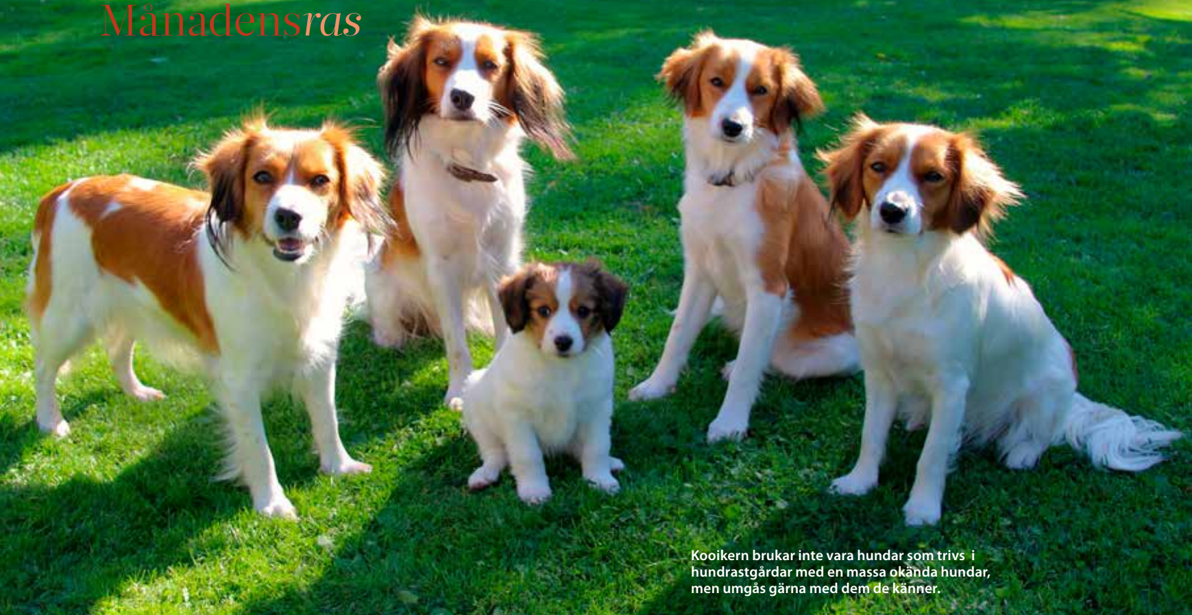
Kooikern brukar inte vara hundar som trivs i hundrastgårdar med en massa okända hundar, men umgås gärna med dem de känner.

» K ooikerhondje är en hund med en sund kroppsbyggnad utan överdrifter. Proportionerna ska vara näst intill kvadratiska med passande benstomme. Enligt rasstandarden ska mankhöjd för hane vara 37–42 cm och tik 35–40 cm, men storleken varierar. Pälsen är glansande, medellång, lätt vågig till slät, vit med orangeröda fläckar och typiska svarta fransar på öronen. Det är en ras där hundarna ofta blir mycket gamla och är pigga högt upp i ålder.